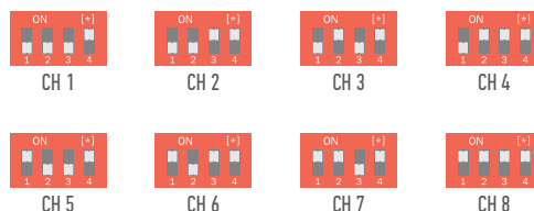
DIP switch settings